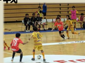
ボアルース長野前座試合