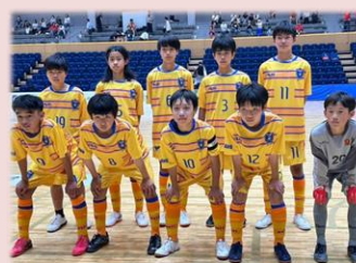
イエローユニフォーム