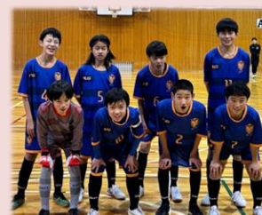
ブルーユニフォーム