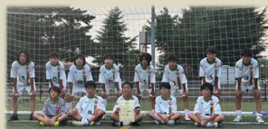
千曲市長杯準優勝